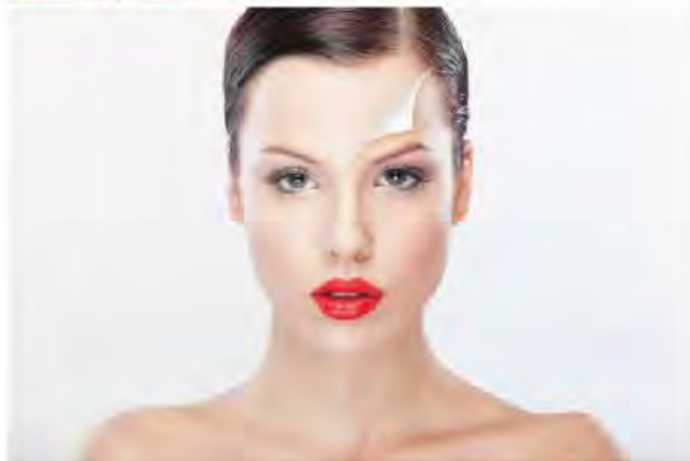
Ultherapy, il lifting non chirurgico

Consiglia | Condividi | Una persona consiglia questo elemento.